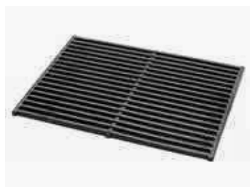
чугунная решетка для гриля