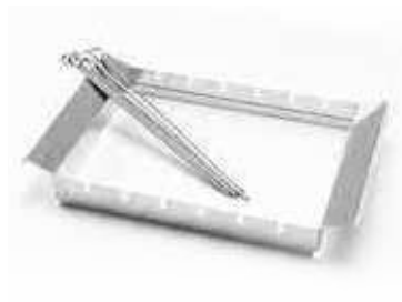
6 шампуров и подставка