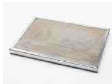
камень для пиццы