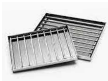
поддон с решеткой