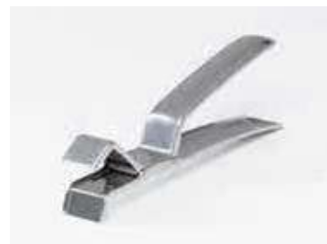
ручка для поддона с решеткой